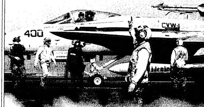
ملازمة حربية امريكية تستعد لالاقع معجزة لفرانك من فوق جماعة المقاتلات دوجوار واشتلون امن (بيزنطيا)

الرباط - القدس العربي: على مسافة 103 كلم في جنوبي غرب الجزائر في منطقة تمنيا، يقيم يونس باسعفاها لاستخدام اسلحة نووية 9 رآي طارق مصاروة يكتب عن الجديد في أزمة الخليج 17 الرباط - القدس العربي: على مسافة 103 كلم في جنوبي غرب الجزائر في منطقة تمنيا، يقيم يونس باسعفاها لاستخدام اسلحة نووية 9 رآي طارق مصاروة يكتب عن الجديد في أزمة الخليج 17